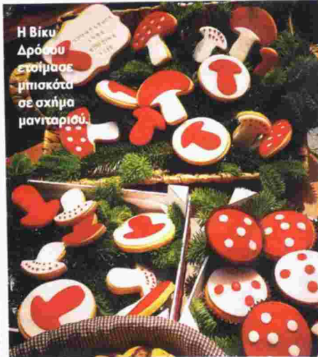
Η Βίκυ Δρόσου ετοιμάσε μπισκότα σε σχήμα μανιταριού.