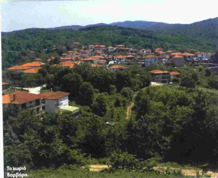
Το χωριό Βαρβάρα.