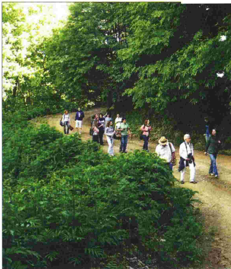
Ο Αριστοτελικός Περίπατος είναι μία διαδρομή 22 χιλιομέτρων μέσα σε Στάγειρα (δεξιά επάνω). Δεξιά: Μέγας Αλέξανδρος και Αριστοτέλης

Ο χαρτογραφημένος Αριστοτελικός Περίπατος, στη Χαλκιδική, που ξεκινά από το προστατευόμενο (Natura) Άλσος του Αριστοτέλη και καταλήγει στα Αρχαία Στάγειρα, γενέτειρα του αρχαίου φιλοσόφου, είναι γεμάτος Ιστορία, γνώση και φύση που κόβει την ανάσα. Θα παρουσιαστεί δε από τον Οργανισμό Τουριστικής Ανάπτυξης προ του Αθω, στις 9 Σεπτεμβρίου, ως η πρώτη από τις οκτώ χαρτογραφημένες ιστορικές περιπατητικές διαδρομές της προ του Αθω περιοχής, ώστε να ανα-